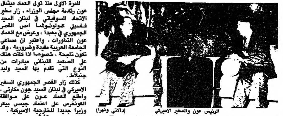
الرئيس عون والسفير اميري (الراي ونورا)

للمرة الاولى منذ تولي العماد ميشال عون رئاسة مجلس الوزراء، زار سفير الاتحاد السوفياتي في لبنان السيد فاسيلي كولوتوشا امس في قصر العماد الجمهوري في بيروت، وعرض مع العماد عون التاورات، واعتبر ان مساعي الجامعة العربية مفيدة وضرورية، وقد تكون ناجحة، خصوصاً اذا كانت هناك على الصعيد اللبناني مبادرات من النوع التي تقدم بها السيد وليد جنبلاط.